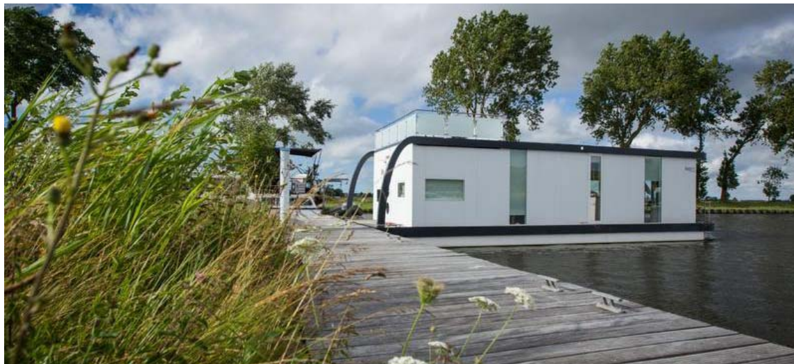
Amarré à Nieuport, le premier modèle de Homeboat permet aux touristes d'expérimenter la vie sur l'eau, avec un confort très proche de celui d'une maison.

► Nécessité pour certains, plaisir pour d'autres, l'habitat sur l'eau se répand de plus en plus.